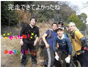
完走できてよかったね